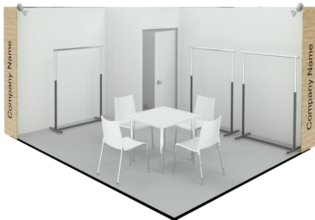
Пример стенда площадью 12 кв.м.

При стандартной застройке не допускаются изменения высоты стен стенда, освещения, цвета коврового покрытия, размещения каких-либо изображений, кроме логотипа компании на колоннах.